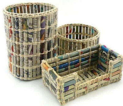
Gambar 5 : Contoh kerajinan bahan kertas https://bahanperekat.com/merambah-ekspor-kerajinan-dari-limbah-kertas-yang-prospektif/

Kertas merupakan bagian dari limbah organik kering, hal ini karena kertas mudah terurai dalam tanah. Meskipun kertas mudah hancur jika terkena air, namun jika digunakan sebagai bahan dasar produk kerajinan, kertas tersebut dapat diolah sedemikian rupa sehingga tidak mudah hancur. Caranya yaitu dengan menambah kandungan lem atau zat pelindung anti air seperti melamin/politur, dapat pula dengan dilapisi plastik. Limbah kertas dapat digunakan sebagai benda kerajinan dengan berbagai teknik seperti teknik anyaman, teknik sobek, teknik lipat, dan teknik gulung (pilin).