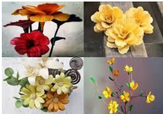
Gambar 2: Contoh kerajinan bunga dari limbah jagung

Kulit jagung merupakan limbah pertanian dari tanaman jagung. Kulit jagung kerap kali tidak diperhatikan, bahkan dianggap sampah sehingga biasanya dibuang. Sampah kulit jagung bisa menjadi benda kerajinan yang sangat bernilai dan bias mendatangkan keuntungan. Kerajinan dari limbah kulit jagung ini sangat unik dan menarik.