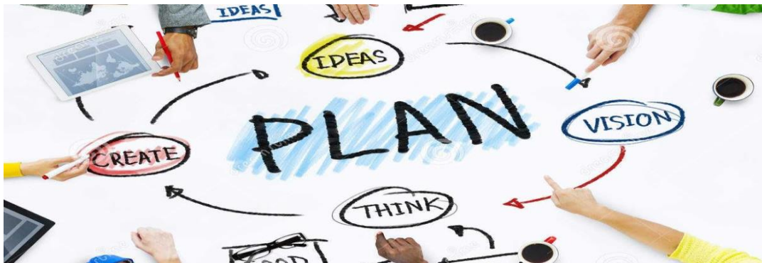
Gambar 11 : Rencana usaha

https://www.pustakamadani.com/2019/06/perencanaan-usaha-kerajinan-dari-bahan.html