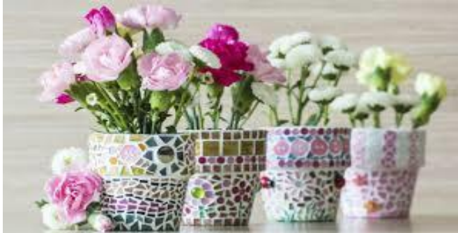
Gambar 9: Contoh kerajinan pecahan keramik

Pecahan keramik ternyata dapat dimanfaatkan untuk kerajinan atau hiasan. Pecahan-pecahan keramik dapat dijadikan sebagai hiasan mozaik, atau hiasan yang lainnya. Biasanya mozaik dari pecahan keramik disusun untuk membuat gambar bercorak abstrak atau background dari suatu gambar atau untuk melapisi dinding dan lantai agar terkesan unik.