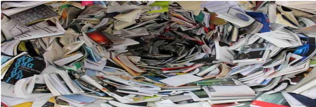
Gambar 1 : Limbah kertas

http://www.koran-jakarta.com/baterai-baru-dari-olahan-sampah-kertas/