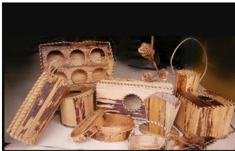
Gambar 3 : Contoh kerajinan dari daun pelepah pisang

Sebagian besar masyarakat menganggap daun pelepah pisang kering adalah sampah yang tidak berguna. Bahkan terkadang daun pelepah pisang kering hanya dibakar begitu saja karena dianggap sampah yang mengotori kebun. Namun daun pelepah pisang kering dapat dijadikan sebagai kerajinan yang indah dan memiliki nilai ekonomi yang tinggi. Kerajinan tangan dari daun pelepah pisang kering sebaiknya menggunakan daun yang berwarna kuning hingga daun yang berwarna coklat dan benar-benar kering.