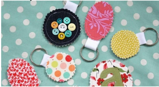
Gambar 6 : Contoh kerajinan kain perca https://www.romadecade.org/kerajinan-dari-kain-perca/#!

orang melirik produk kerajinan berbahan kain perca, karena selain murah juga desainnya unik.