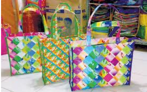
Gambar 4: Contoh produk kerajinan bangun datar http://kerajinanprakarya.blogspot.com/2020/01/kerajinan-bahan-limbah-bangun-datar.html

Apakah di lingkunganmu banyak sampah plastik yang menumpuk? Kalian bingung untuk memanfaatkannya? Kita tahu bahwa sampah plastik termasuk dalam sampah anorganik yang sulit diurai oleh mikroorganisme, butuh waktu bertahun-tahun supaya plastik dapat terurai dan akhirnya menyatu dengan tanah. Oleh karena itu, sebaiknya sampah plastik tersebut dimanfaatkan untuk karya kerajinan. Saat ini sudah banyak kerajinan yang dibuat dengan bahan dasar limbah plastik seperti tas, dompet, cover meja, dan tempat tisu.