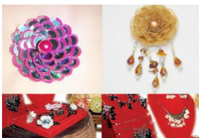
Gambar 8 : Contoh kerajinan sisik ikan https://openjualan.net/kerajinan-dari-limbah-sisik-ikan/

Sisik ikan pada umumnya hanya dibuang karena dianggap sebagai limbah yang tidak bermanfaat. Ternyata sisik ikan dapat dimanfaatkan untuk benda kerajinan, pada umumnya untuk kerajinan aksesoris. Setiap ikan menghasilkan sisik yang berbeda ukuran dan ketebalannya. Sisik ikan kakap sering digunakan sebagai produk kerajinan karena sisiknya lebih terlihat kokoh, tebal, dan besar dibanding sisik ikan mas atau mujair. Limbah sisik ikan bisa dijadikan sebagai bahan utama pembuatan aksesoris seperti anting-anting, cincin, kalung, bros, dan gelang. Hasilnya terlihat unik, artistik, dan menarik.